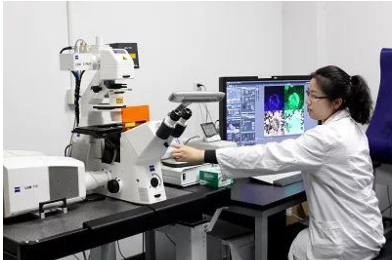
参观中科院南京土壤研究所国家重点实验室分析测试中心

短暂的休息过后，营员们又投入了编程课程的学习与讨论中。经过前三天的学习与尝试，营员们已经较好地掌握了基本的编程语法，并将其运用到自己的编程作品中。同时，“心向南兮，以梦为码”编程大赛也受到了大家的积极响应，截止目前收到了很多质量较高的编程作品。相信大家一定会从科学营中得到启发，爱上编程，更好地适应信息化科技时代！