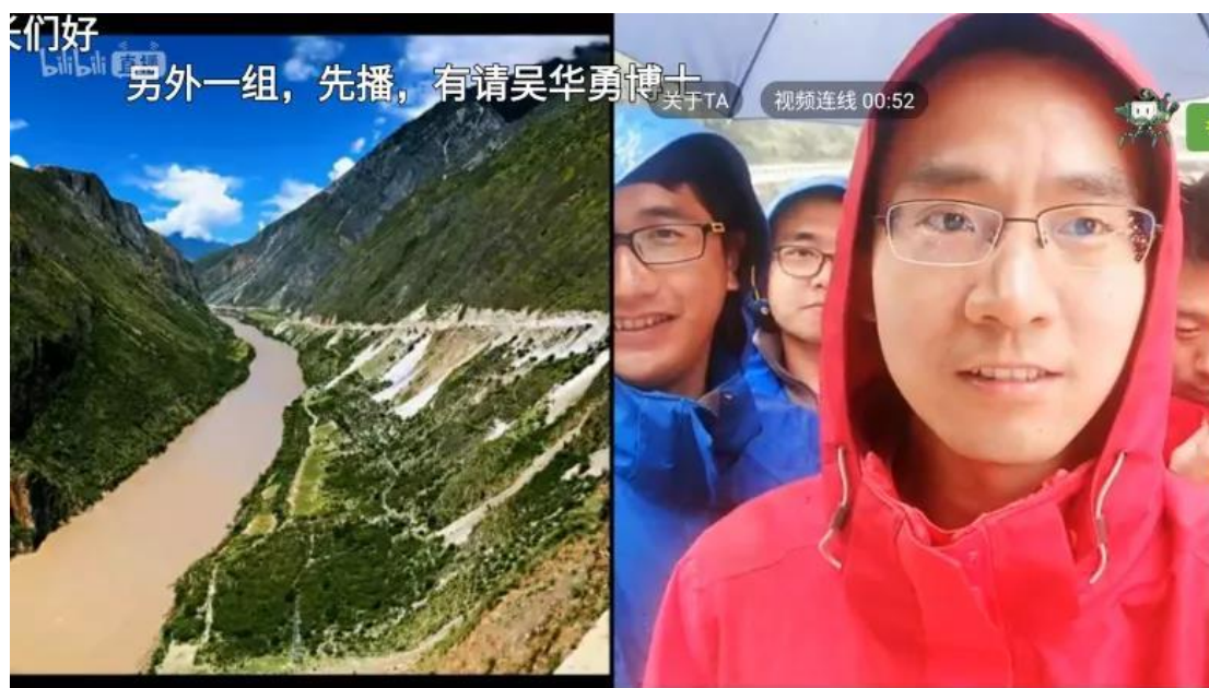
直播连线中科院南京土壤研究所西藏科考队员

藏高原地区土壤资源的质量、数量和空间分布信息。营员们就科研、生活等方面在直播间互动提问并收到了解答，他们也在这一次面对面的交流中认识到，正是由于这群奔赴“世界屋脊”的科研工作者的努力，我们才能够获取土壤研究的第一手资料，为更好地理解我国的土壤资源信息和管理提供了保障。