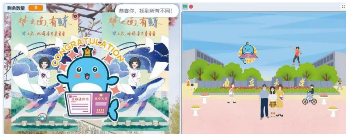
收到的营员编程作品

短暂的休息过后，营员们又投入了编程课程的学习与讨论中。经过前三天的学习与尝试，营员们已经较好地掌握了基本的编程语法，并将其运用到自己的编程作品中。同时，“心向南兮，以梦为码”编程大赛也受到了大家的积极响应，截止目前收到了很多质量较高的编程作品。相信大家一定会从科学营中得到启发，爱上编程，更好地适应信息化科技时代！